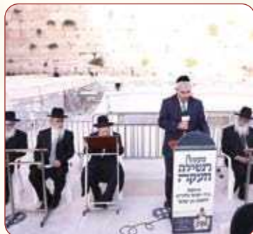
החזן העולמי משה חבושה הי"ו