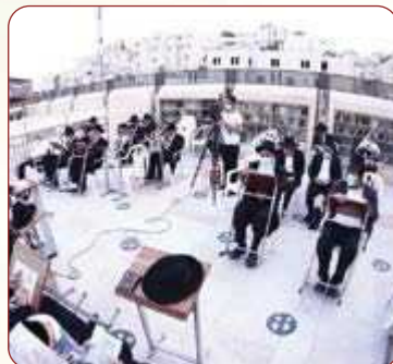
גדולי ישראל במעמד התפילה