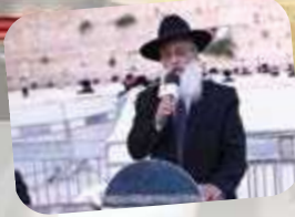
תפילת מרדך ורבנן שליט"א בכותל המערבי (עמוד 3)

דבר ראש המוסדות אאת הרב יהורם יפת שליט"א