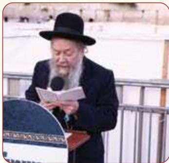
המקובל הגה"צ הרב דוד בצרי שליט"א