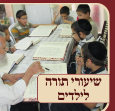
שיעורי תורה לילדים