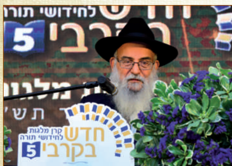
הגאון רבי מרדכי יצהרי שליט"א נשיא הארגון

השגחה פרטית מיוחדת ניכרה לאחר מעשה, כאשר רבים תמחו על הקדמת הכנס לליל תענית אסתר, מספר שבועות לפני מועד קיומו בכל שנה. אמנם, שלושה ימים לאחר קיום המעמד האדיר כבר החלו ההגבלות על קיום כינוסים ציבוריים לשם שמירת הבריאות, ומאת ד' היתה זאת שמעמד 'חדש בקרבי' היה מן המעמדים הציבוריים האחרונים שבהם היו יכולים להתכנס אלפי אנשים יחדיו לכבודה של תורה. ובחסד ד' - איש מן המשתתפים במעמד הכביר לא התגלה כחולה, ולא נצרך להיכנס לבידוד וכיוצא בזה. יצוין עוד כי בשל המצב בחודשים האחרונים נדפס גיליון חודש ניסן בפורמט מצומצם, ומשום כך מתפרסם בזאת שוב הסיקור הנרחב על המעמד הגדול. זמן רב קודם פתיחת השערים כבר צבאו הממונים על פתחי האולם, משכן האירועים 'קונקורד' היוקרתיים בבני ברק, שנשכרו במיוחד בכדי להכיל את המוני המשתתפים, מרנן ורבנן גדולי התורה ראשי הישיבות ומורי ההוראה, לצד תלמידי