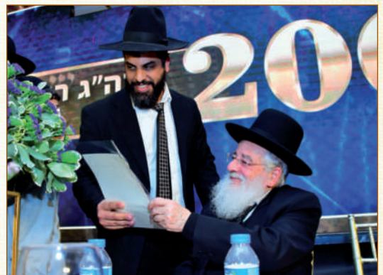
הגאון רבי פנחס קורח בחלוקת מלגות