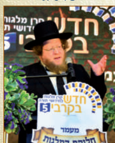
הגאון רבי שלום בער סורוצקין שליט"א