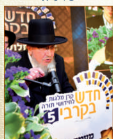
הגאון רבי ברוך מרדכי אזרחי שליט"א