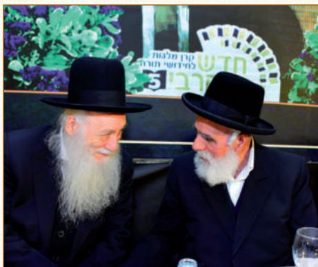
הגאונים רבי שלמה מחפוד ורבי אליעזר כהנמן שליט"א