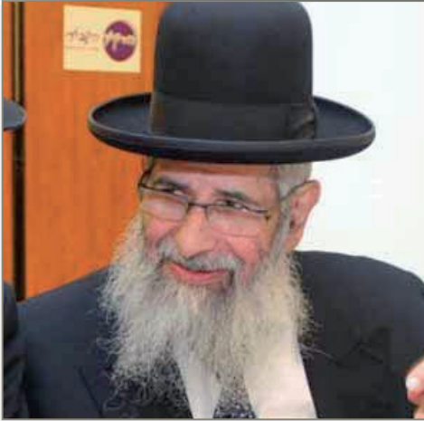
רבי ישראל שרעבי זצ"ל