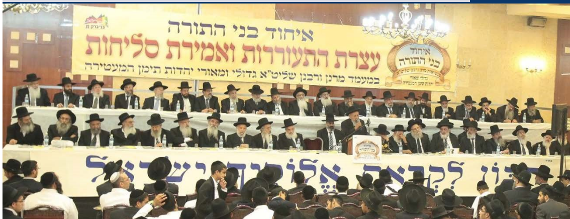
▲ מהפכה רוחנית מתחוללת. כינוס איחוד בני התורה לעדת תימן בבני ברק